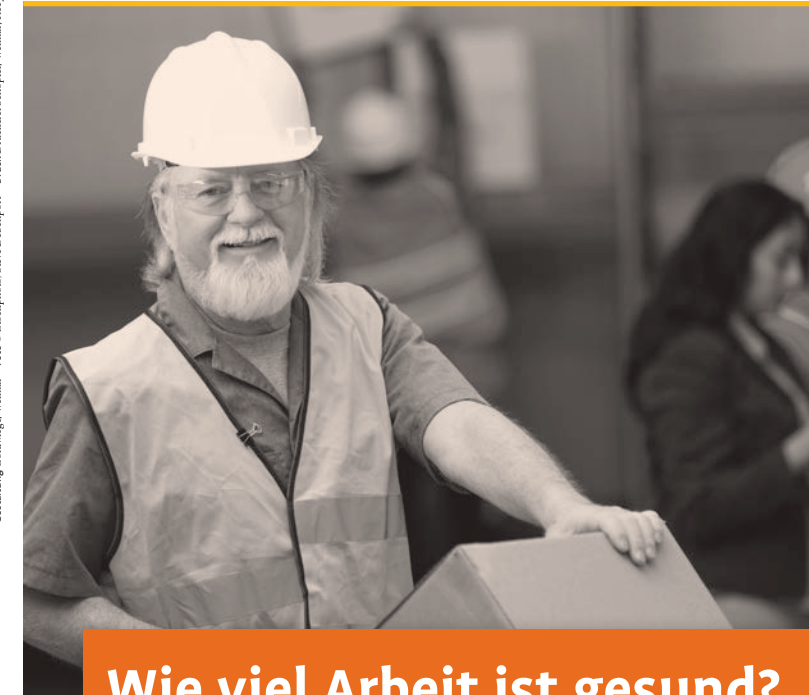
Gestaltung: Goldwege, Weimar. Druck: Druckererei Schöpfel, Weimar. Recycling-Papier mit Bio-Druckfarben.